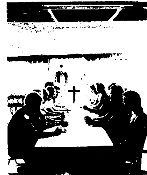
Så er der hygge-time: Feltpræsten er på et af sine kærkomne besøg, Cammander læser indgangsbønnen og Gudstjenesten kan begynde.