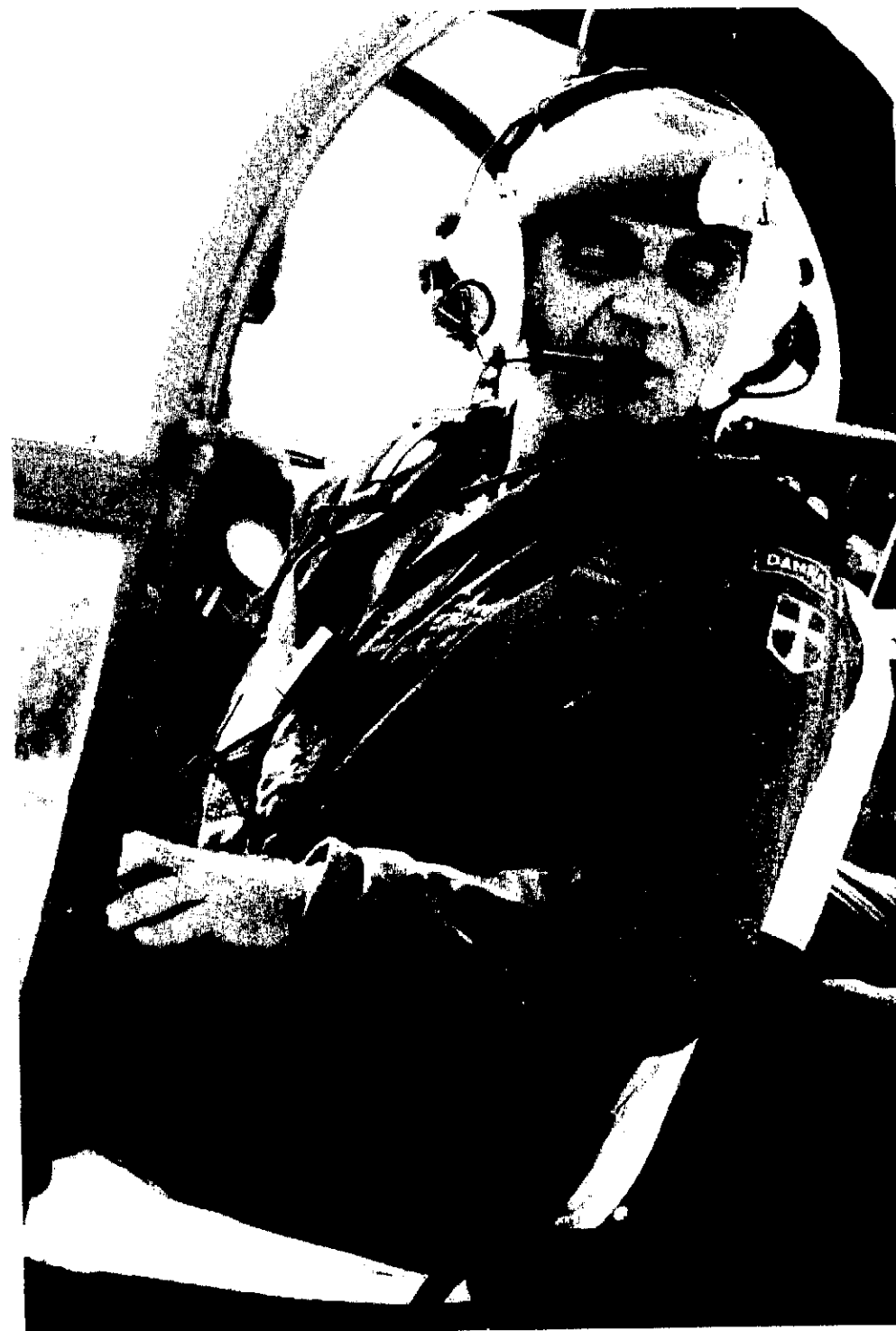
COMMANDER blår til en inspektionstur i bufferzonen