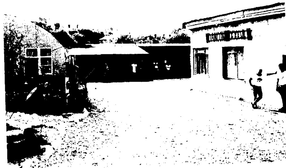
Kokkina-camp. En dejlig lejr, i et dejligt område i et dejligt land.