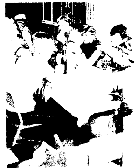
Så er der hygge-time. De "gamle" holder "tal-fest"