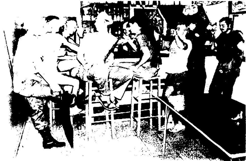
Så er der hygge-time: Med hat og stok, lidt øl og masser af højt humor ordner man samtlige verdensproblemer og lidt til.