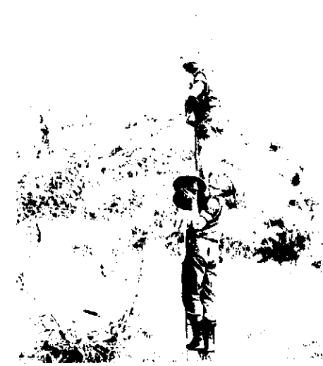
Liniearbejde: Forbindelserne skal være i orden, her retablerer Kantine og den Røde linien til tyrkerne.