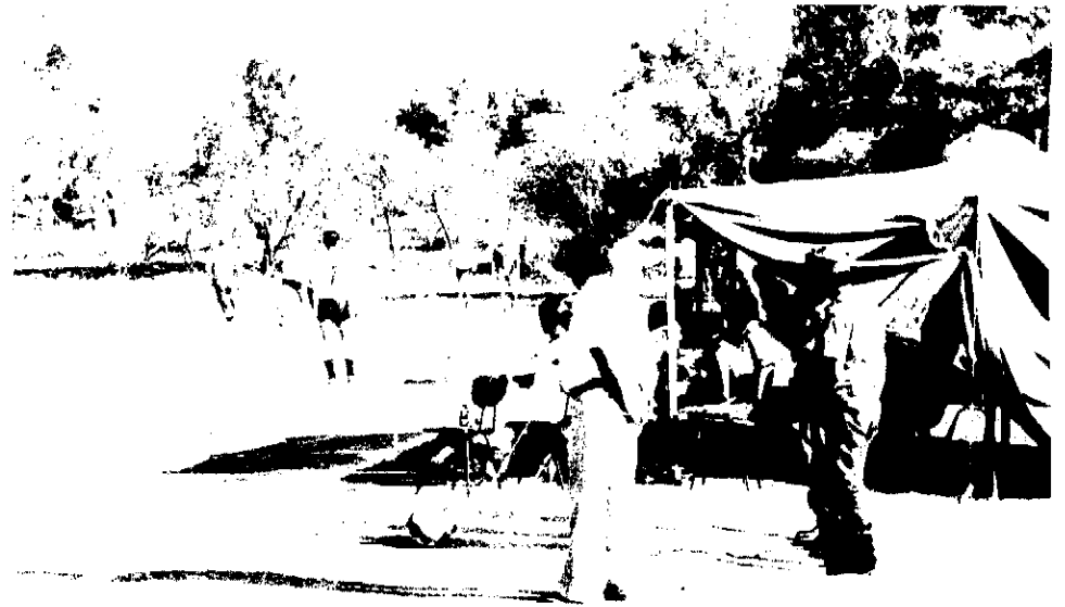
Den 9. juli spillede KMP en fodboldkamp mod et tyrkisk 1. div. hold. Resultatet af kampen blev 6—2 til tyrkerne.