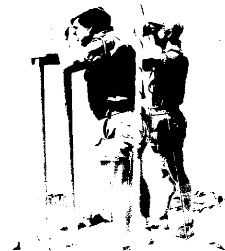
Der er gang i observations-tjenesten. En af parterne er særdeles aktive for tiden og det må der holdes øje med.