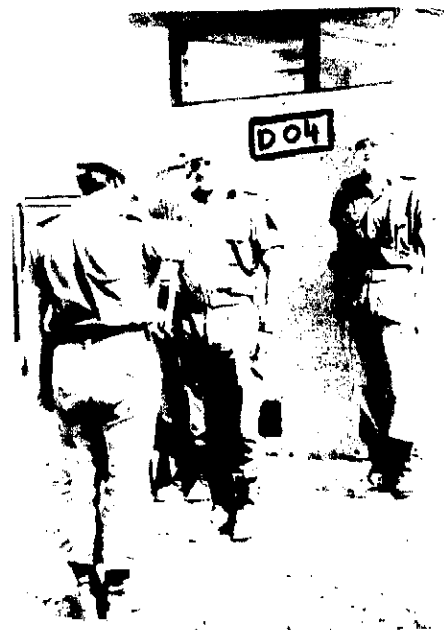
Hr. PL Orum, KP Bak melder, D 04 bemanded, intet at bemærke.

Kokkina-delingen bemander konstant 2 OP'er: D 01 og D 03, men regelmæssigt bemandes D 02 og D 04. Reccerne bemander disse OP'er her observeres ud i ellers uindset terræn, og mange gode oplysninger løber ind ad denne vej.