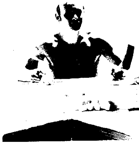
Krølle i merkampstilling. Hva' så gutter - ska' vi gå i'en igen?