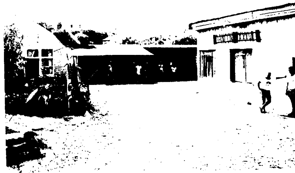
Kokkina-camp. En dejlig lejr, i et dejligt område i et dejligt land.